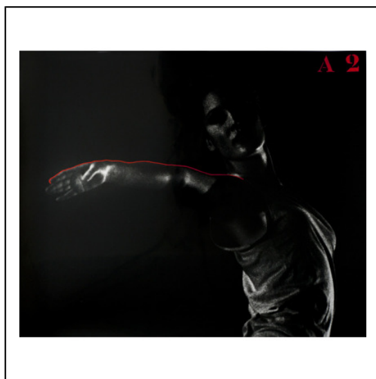
A BRAS TENDU A2.jpg