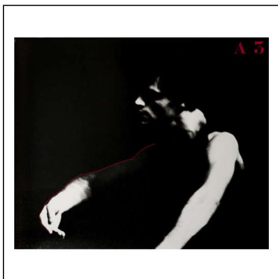
A BRAS TENDU A3.jpg