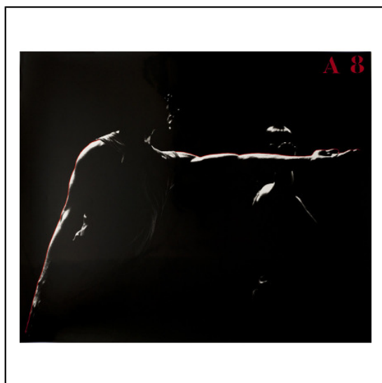
A BRAS TENDU A8.jpg