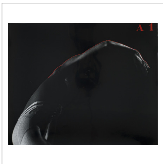
A BRAS TENDU A1.jpg