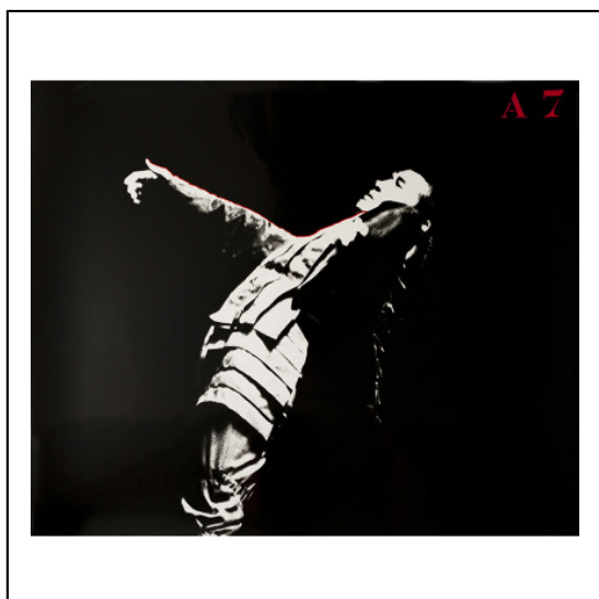
A BRAS TENDU A7.jpg