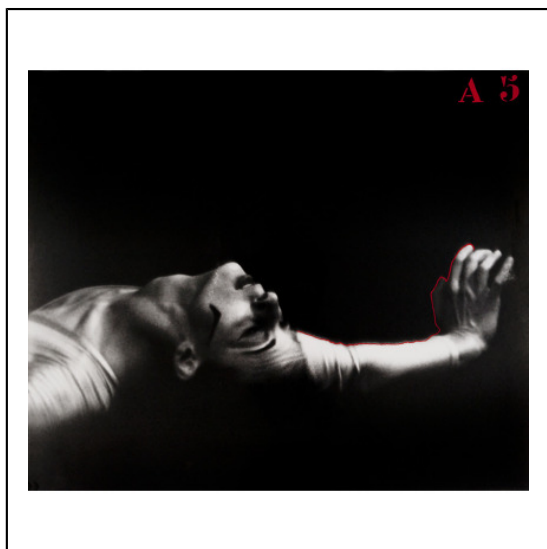
A BRAS TENDU A5.jpg